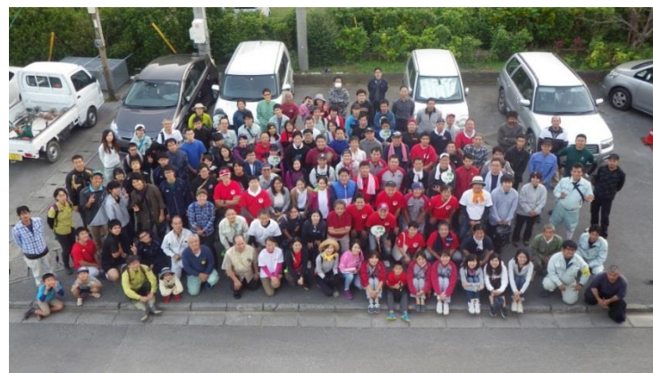
参加者の集合写真