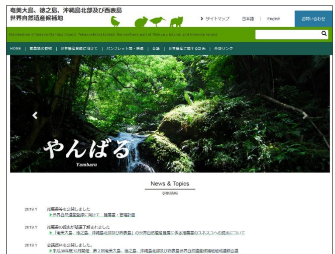
世界自然遺産推薦地の公式ホームページ

http://kyushu.env.go.jp/naha/amami-okinawa/index.html