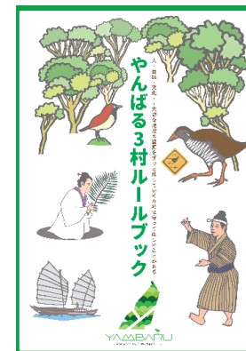
やんばる3村ルールブック