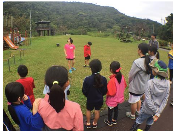
現地（山と水の生活博物館）での子ども会議の様子