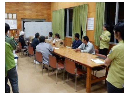
パトロールに関する打合せ

やんばる地域の生き物を守るための取組の一つとして、希少種の盗掘や盗採を防止する林道パトロールを実施しています。林道パトロールは国頭村森林組合等地元の方が中心となり、これまでも継続して実施してきましたが、2018 年 10 月、国や県、村、警察官も参加するパトロールを実施し、警察との連携体制を整えました。また、今後、通常の林道パトロールの範囲と回数を拡充し、さらに警察との連携を深化し、密猟防止のための監視体制を大幅に強化することを予定しています。