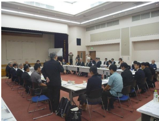
H30 第2回地域連絡会議の様子

再推薦に向け、12月に開催された12市町村の首長が集まる地域連絡会議で包括的管理計画の改定を行い、科学委員会（有識者会議）などの結果を踏まえ修正した推薦書を作成、2月に再提出されました。