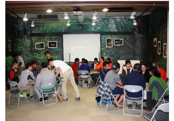
グループワークで議論

参加者の感想として、「身近に教材となる自然がたくさんあった」、「インタープリテーションを初めて知った」、「『環境教育』や『持続可能な社会』が指導要領にあり困惑していたが、今日の話を聞き、地域での活動を充実させることが大事だと感じた」などがありました。