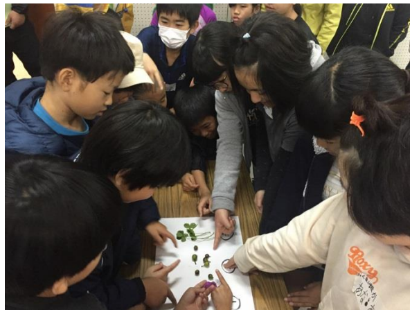
やんばるでの子ども会議の様子

やんばる地域の子どもたちが、世界自然遺産候補地の他の3島（奄美大島、徳之島、西表島）の子どもたちと交流する取組が始まりました。この取組（「奄美と琉球の世界自然遺産次世代継承交流体制構築事業」）により、子どもたちが、住んでいる地域の自然への理解を深め、地域間での交流をとおして次世代へつなげていくことを目的にしています。今年度は、「世界自然遺産子ども会議設立総会」を奄美大島、徳之島、やんばる地域（国頭村、大宜味村、東村）及び西表島の各地で開催し、子どもたちが地域の宝を探して発信することの大切さを学びました。