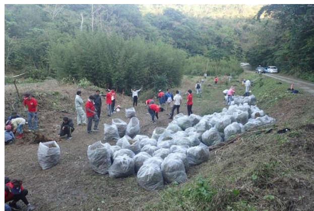
ツルヒヨドリ駆除作業の様子

2018 年 11 月 23 日（金）、大宜味村田嘉里区において、生態系に悪影響を与える特定外来生物であるつる性の植物ツルヒヨドリの除去を行いました。田嘉里区の方々をはじめ、辺土名高校の生徒、やんばる3村の職員、沖縄県職員、環境省職員、民間企業など多くの方々が参加し、ゴミ袋にして 200 袋以上のツルヒヨドリを除去しました。ツルヒヨドリの駆除作業を行うことで、やんばる地域における分布域拡大を防ぐとともに、生物多様性への外来種の影響について知ることができました。