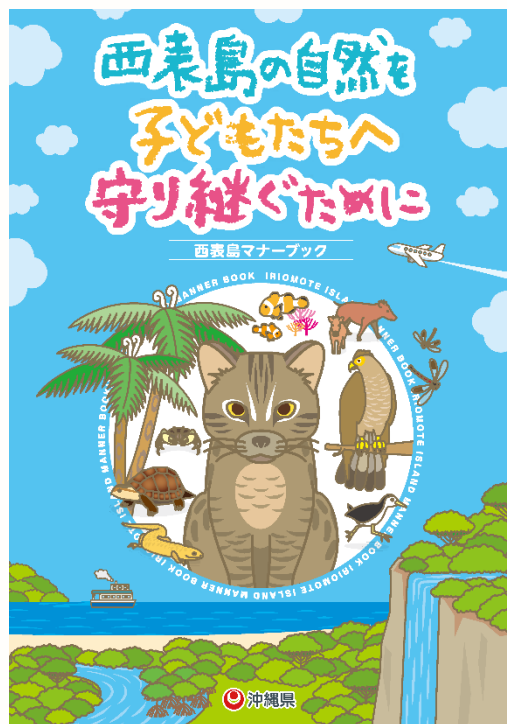
西表島マナーブックの表紙