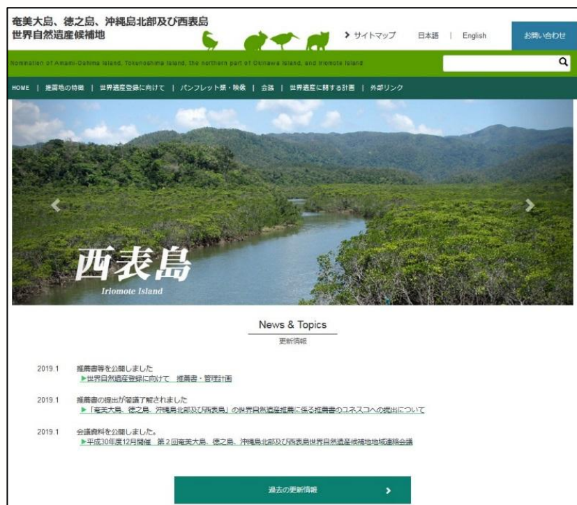
世界自然遺産候補地のホームページ

観光客向けのマナーブック「西表島の自然を子どもたちへ守り継ぐために」を作成しました。ゴミを持ち帰ることや車の制限速度を守ることなど、西表島を観光で訪れるにあたって守るべきルールやマナーをとりまとめたものです。船会社やJTAの協力を得て、チケットの購入時に全ての来訪者へ手渡しで配布することとしています。