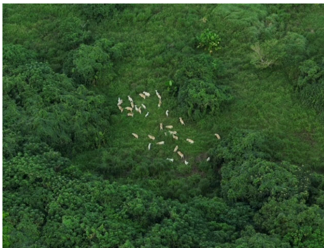
ドローンで撮影されたノヤギの群れ (西表島東部地区)