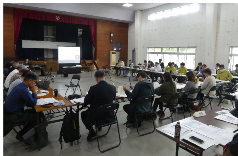
令和5年度第2回西表島部会の様子