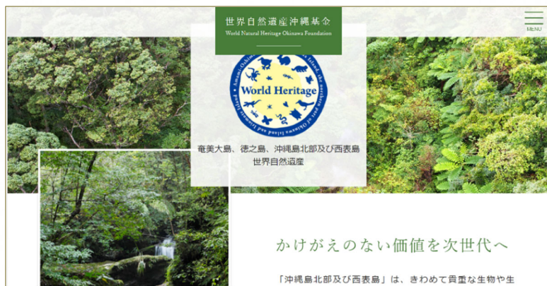
世界自然遺産沖縄基金 HP ( https://churashima.okinawa/wnhof/ )

世界自然遺産沖縄基金は、世界自然遺産推進共同企業体からの要請を受け、一般財団法人沖縄美ら島財団が管理・運営をしています。