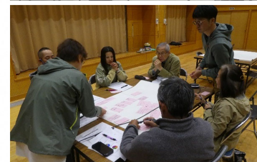
勉強会やワークショップの様子