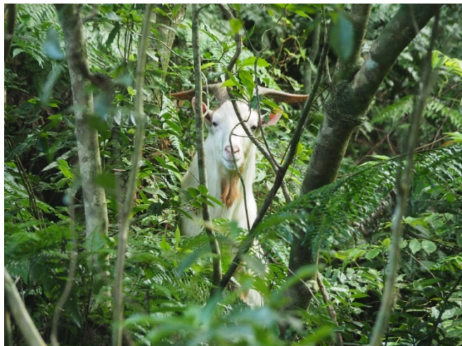
古見岳付近で確認されたノヤギ

また、ノヤギの問題について町民の皆様に知ってもらうため、環境省及び竹富町農林水産課の主催により令和5年11月に講演会「ノヤギについて考えよう」が開催されました。ノヤギの生態や生息状況に関する質問や、効果的な駆除方法、捕獲したノヤギの活用等について、活発に意見が交わされました。