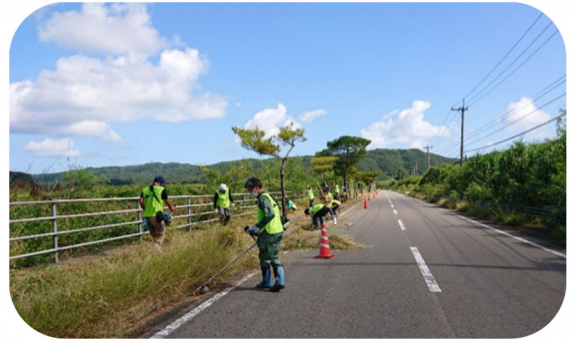
県道での草刈りの様子

ヤマネコの交通事故を防ぐため、地域の皆さんや行政機関、地元団体等により、道路の草刈り、注意喚起看板の設置、交通安全運動など、様々な取組が行われています。環境省の「西表島 yuriCargo(ゆりかご)プロジェクト」では、スマートフォンアプリによりドライバーが安全運転の診断を行い、基準を満たすと優良ドライバー認定を受けられます。また、沖縄県では高那地区でのヤマネコ進入防止柵を設置しているほか、交通速度を調査するための速度検知器による調査、ヤマネコの目撃情報収集システムの開発などの取組を行っております。ヤマネコを見かけた際に、目撃情報収集システムに投稿いただければ、その情報をもとに、交通事故対策につなげることができますので、島民の皆様もぜひご協力ください。