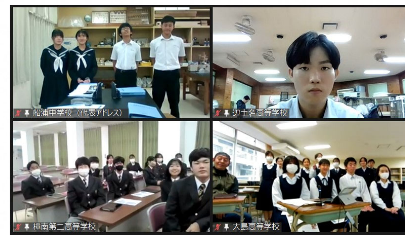
地域連携ミーティングにご参加いただいた生徒