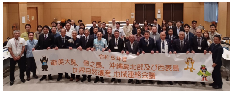
地域連絡会議における写真撮影の様子

令和5年度の西表島部会（事務局：沖縄県自然保護課）を令和5年8月25日（金）及び令和6年2月13日（火）に開催しました。世界自然遺産である「西表島」の適正な保全・管理の推進に向け、地域で話し合いを行っています。今年度は、西表島の自然環境や観光の状況のモニタリングの手法や体制について議論され、観光による影響を評価するための「西表島モニタリング評価委員会」が設置されました。今後、評価項目や評価手法について検討を進め、西表島の自然環境や地域社会がよい状態に保たれているかどうか、どのような問題がどの程度生じているかを継続的に把握できる体制を作っていきます。